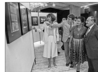
Eröffnung der Ausstellung "Menschen und Momente" 1981 im Europäischen Parlament Strassburg - mit Parlamentspräsidentin Simone Veil.