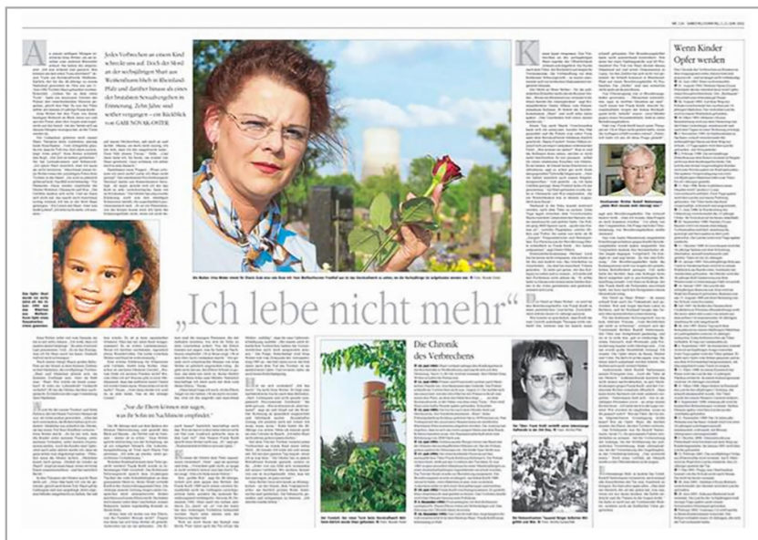
2002 - 10 Jahre nach dem Mord Rhein-Zeitung vom 1.Juni 2002