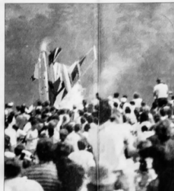
Die Folgen von Ramstein sind vielfältig. Die Opfer von Ramstein werden mit 13 Millionen Mark entschädigt. Die Familien der Verstorbenen werden mit 100 000 Mark entschädigt. Die Familien der Verstorbenen werden mit 100 000 Mark entschädigt.