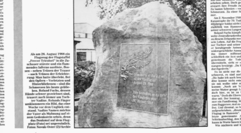
Als am 16. August 1990 die... Flugzeug... ...