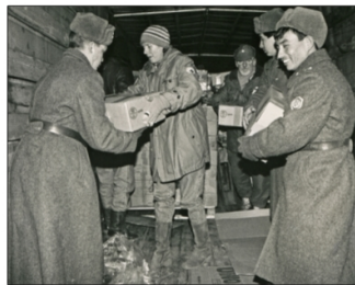
Die verlagseigene Hilfsaktion "HELFT UNS LEBEN" war ihre ganze Leidenschaft. Hier beim "Hungerwinter" in Russland.