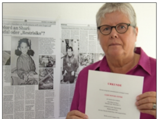
Gabi Novak-Oster - 1993 in Berlin ausgezeichnet mit dem höchsten deutschen Journalistenpreis, dem Theodor-Wolff-Preis.